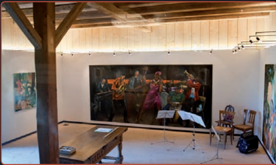
Klingend und bunt - ein gemeinsamer Anlass mit der Musikschule und dem Verein Muse-um-Zürich

Offen für Ausstellungen von Künstlerinnen und Künstlern vorwiegend aus der Region Zürichsee. Zur Verfügung stehen 4 Räume plus ein Foyer für die Vernissagen.