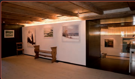
Ausstellung in der Kulturschüür