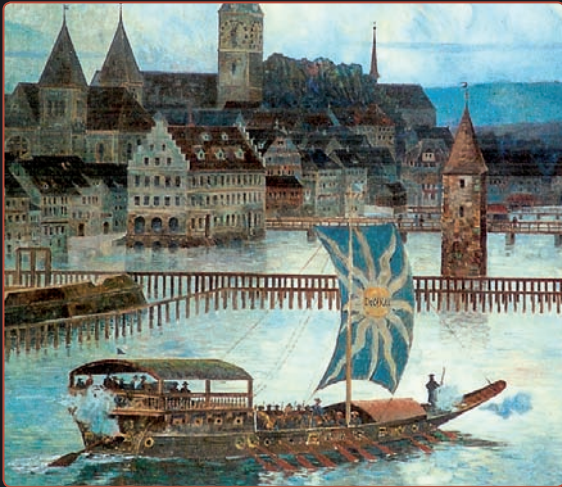
Kriegs- und Staatsschiff Neptun gebaut 1656

Das Schifffahrtsmuseum findet man als virtuelle Ausstellung auf unserer Homepage. Es wird laufend ausgebaut und zeigt die Geschichte der Schifffahrt auf dem Zürichsee. Basis ist unser Archiv.