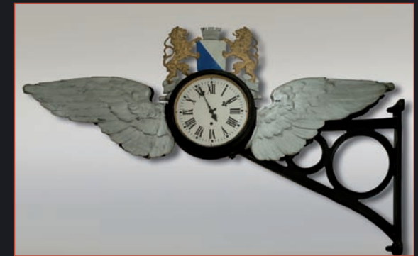
Alte Stationsuhr von Männedorf

Unser Archiv umfasst eine riesige Zahl von Büchern, Broschüren, Dokumenten, Bildern, Fotos und Zeitungsausschnitten. Dazu ist an zwei weiteren Orten eine grosse Zahl von Gegenständen aus alten Zeiten sicher gelagert. Im Laufe der nächsten Jahre werden Archiv und Fundus digital erfasst und stehen dann interessierten Kreisen auf Wunsch zur Verfügung.