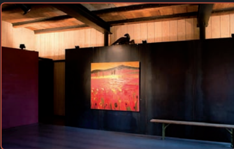
Ausstellungsraum im Foyer